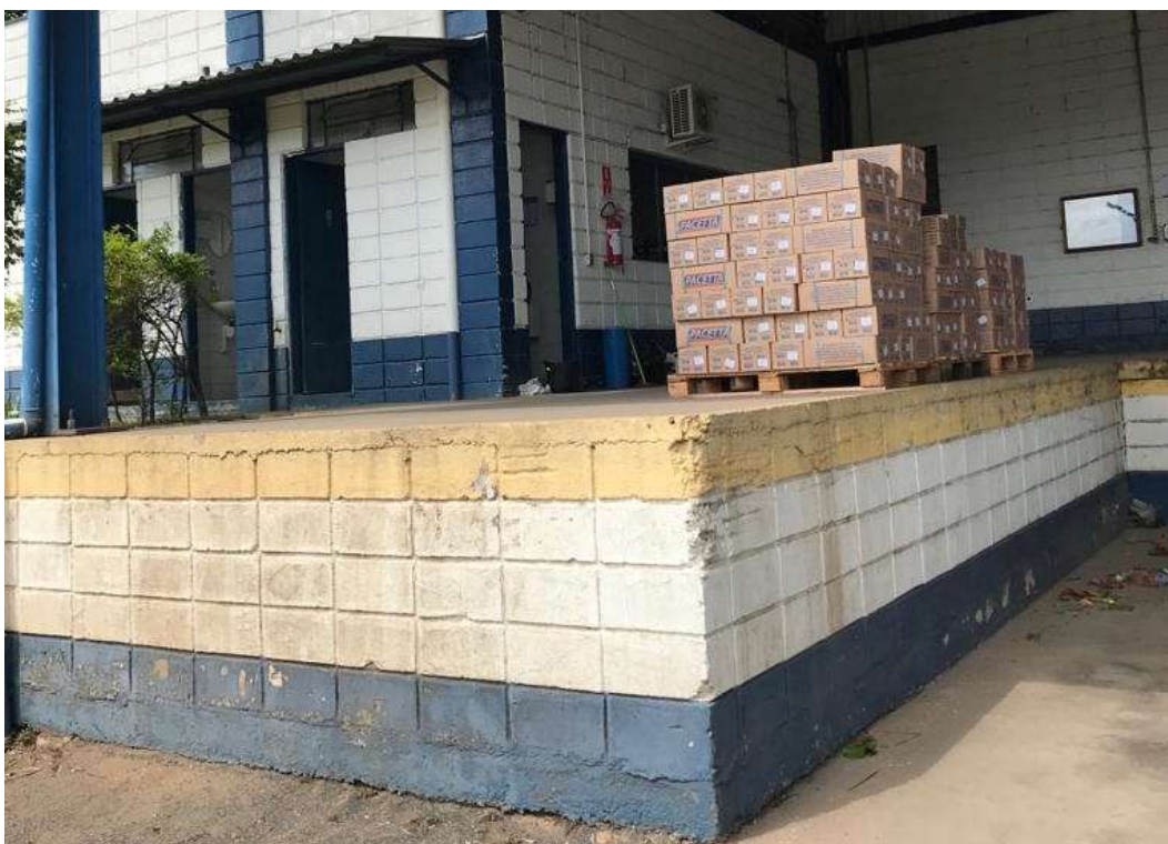
Foto 010: Píer de expedição com material acabado e pronto para despacho.