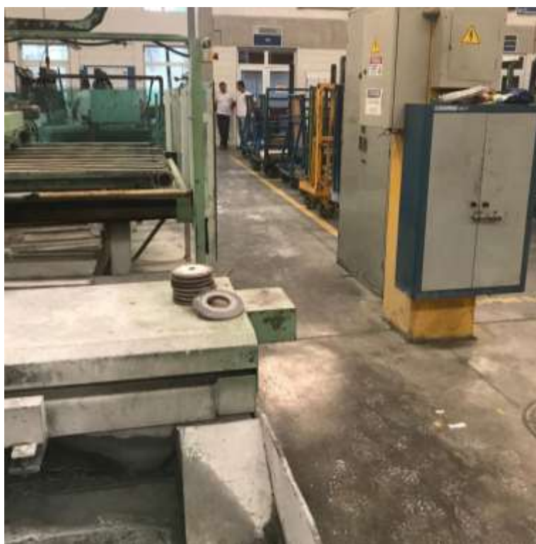
Foto 004: Setor produtivo em funcionamento reduzido (continuação).