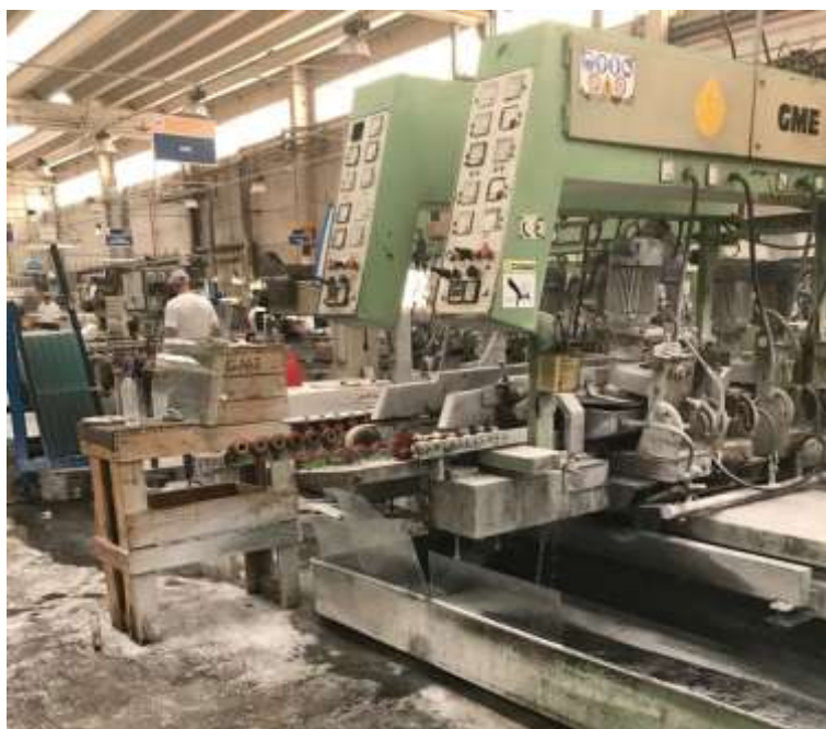
Foto 005: Setor produtivo em funcionamento reduzido (continuação).