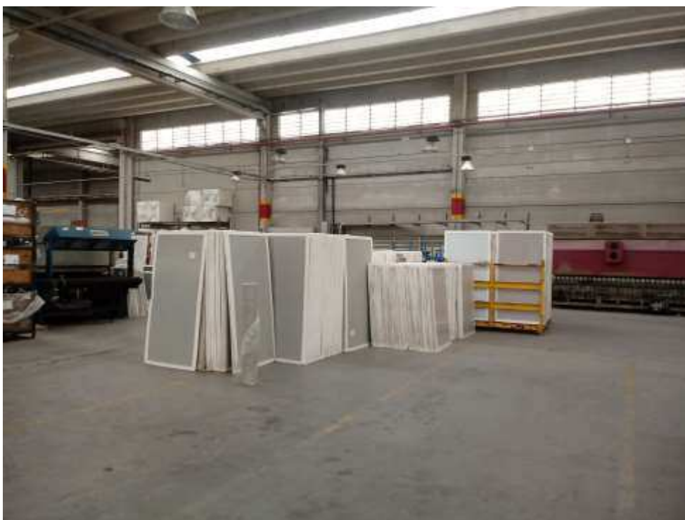
Foto 011: Produto acabado e embalado para despacho em janeiro de 2020.