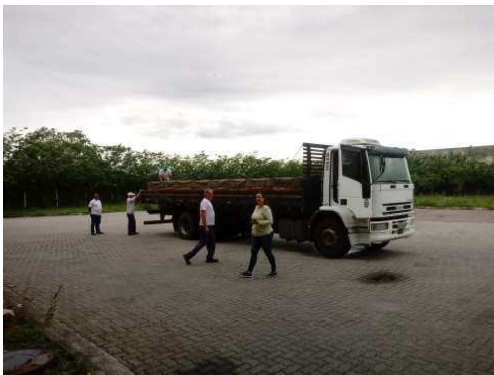
Foto 012: Caminhão com produtos acabados em verificação final para despacho.

Conclusão: Pelo tanto colacionado supra, comparado ao quanto este administrador judicial já constatou em sua última visita, pode-se afirmar que a recuperanda mantém-se em contundente operação, permanecendo a impressão – ao menos visualmente - que a Recuperanda mantém seu escoreito funcionamento.