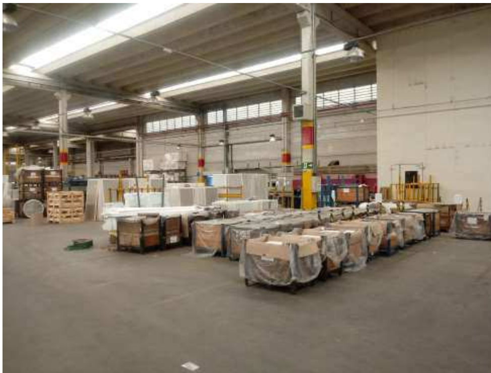
Foto 017: Produtos acabados e embalados aguardando expedição. ( continuação )

Conclusão: Pelo tanto colacionado, ao menos visualmente, é perfeitamente cabível atestar o correto funcionamento da empresa Recuperanda, não havendo alteração desde a última visita deste auxiliar do juízo.