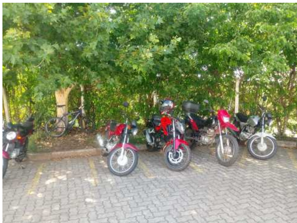
Foto 002: Estacionamento de funcionários e colaboradores. (continuação)