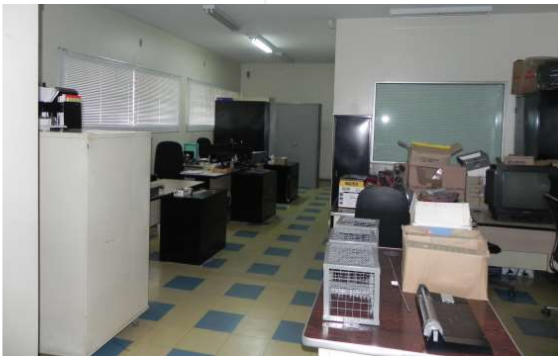
Foto 005: Setor administrativo (colaboradores em horário de almoço)