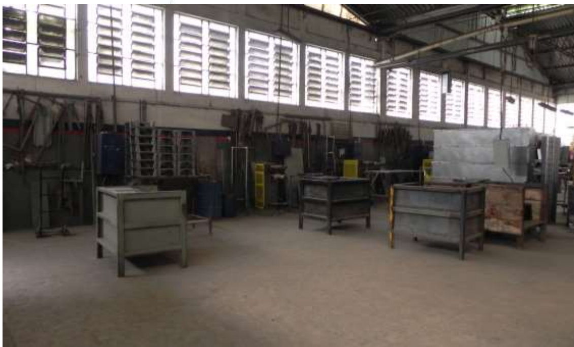
Foto 006: Vista do setor operacional (colaboradores em horário de almoço)