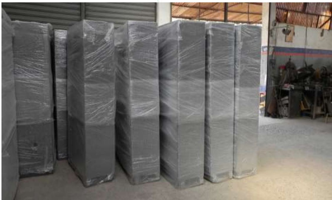
Foto 015: Produtos finalizados prontos para despacho ( continuação )

Conclusão: Empresa em correto funcionamento, com matéria-prima disponível e desenvolvendo regularmente novos produtos. Ambiente administrativo e operacional propício à execução da atividade empresarial.