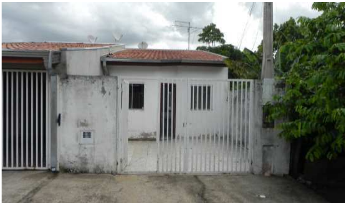
Foto 015: Central de captação de clientes, situado na Rua Suíça, nº 414, Jardim Santa Maria – Sumaré/SP