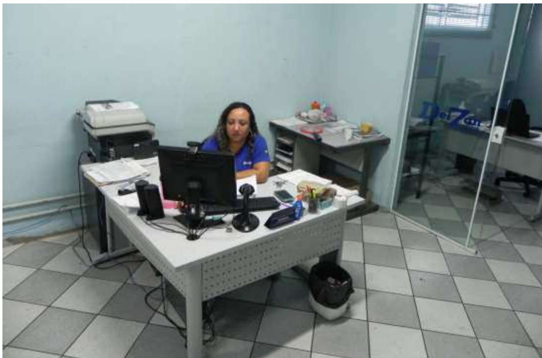
Foto 013: Funcionária trabalhando no setor administrativo da empresa