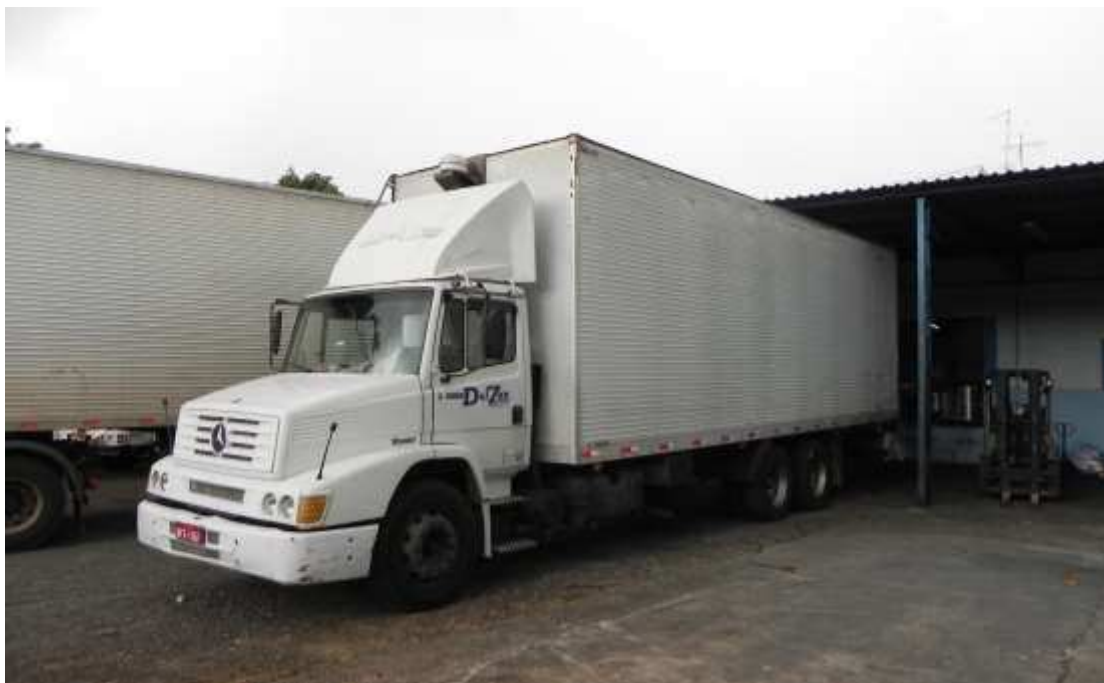
Foto 004: Caminhão com baú de 15 (quinze) metros de comprimento, apto a transportar em torno de 10 toneladas em mercadorias.