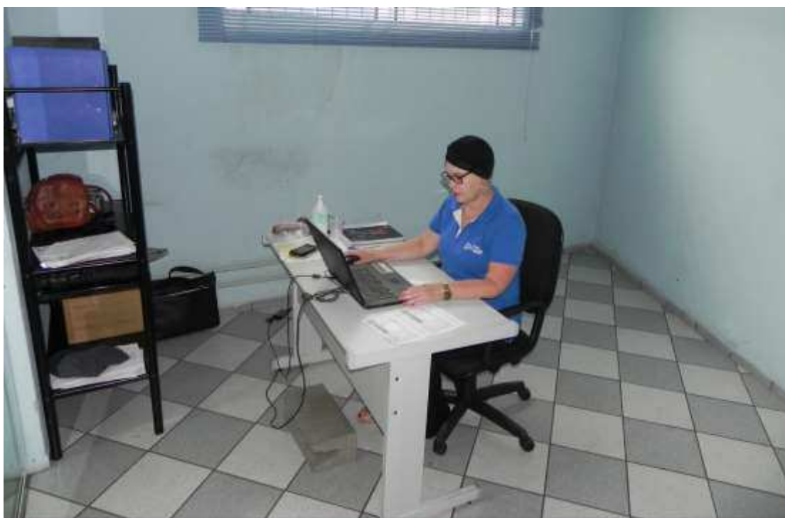
Foto 014: Funcionária trabalhando no setor de recursos humanos da empresa