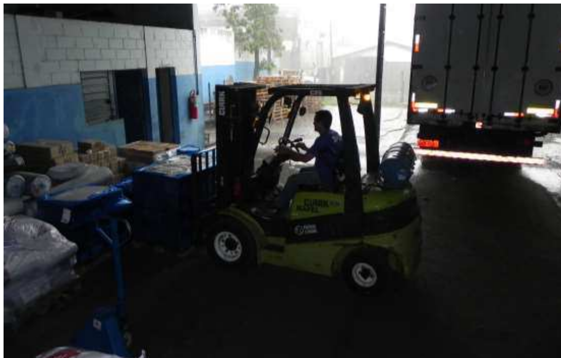
Foto 011: Operador de empilhadeira colocando as mercadorias no caminhão