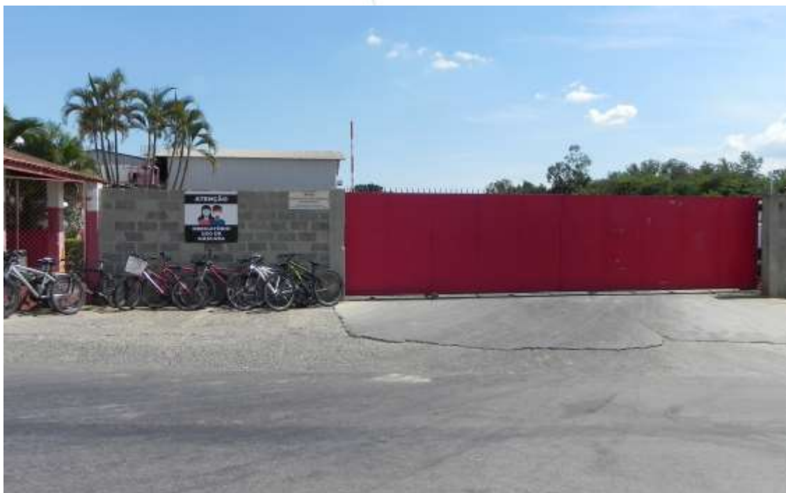
Foto 001: Entrada principal